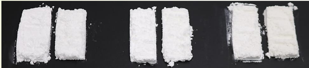
セリサイト（市販品）